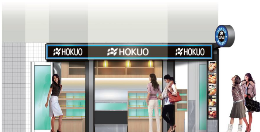
綱島店（東急東横線）店舗（イメージ）

ベーカリーショップ「HOKUO」は、小田急線沿線を中心に店舗を展開しており、近年では首都圏エリアにその事業エリアを拡大しております。今後も、お客さまに身近な駅前のベーカリーとして、「安全・安心・健康・美味」をテーマに、おいしいパンを提供してまいります。