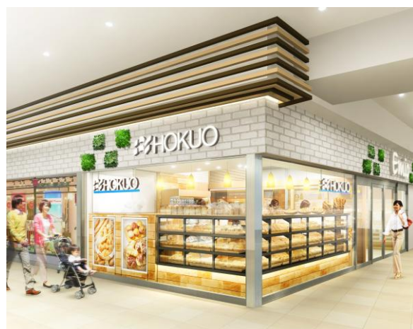
新所沢店（西武新宿線）店舗（イメージ）