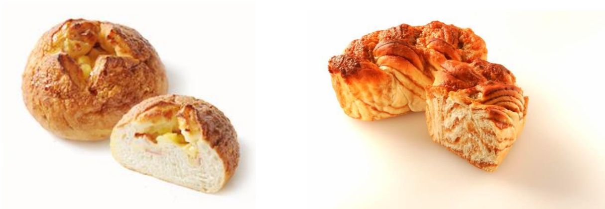
おしょうゆチーズフランス